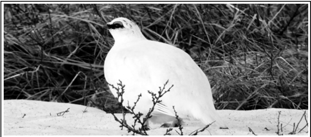
Rjúpa í vetrarbúningi